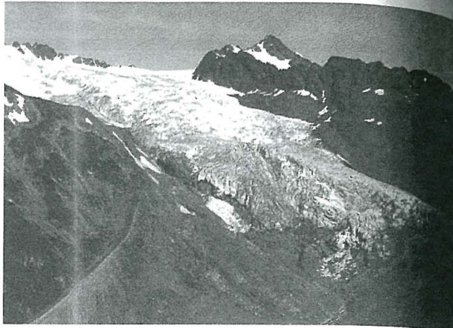
Der Kesselwandferner (Öztaler Alpen), im vollen Vorstoß, 1977 (Heralt Schneider)

Obwohl bis weit herunter viele Altschneeflecken lagen, konnten die 27 vorhandenen Marken einwandfrei nachgemessen werden. Von sieben gemessenen Gletschern waren sechs vorgerückt, nur der Mittelbergferner hatte sich im Mittel um 0,8 m zurückgezogen. Das Gebietsmittel der Längenmessungen ergab einen Vorstoß von 4,2 m gegenüber 3,43 m im Vorjahre. Am größten war der Vorstoß mit 11,3 m am Taschachferner, dessen Zunge sich nun seit 1972 bereits um 61,65 m verlängert hat. Das schon in den letzten Jahren zerstörte Wasserbecken der Braunschweiger Hütte wird von der 40 bis 50 Grad steilen Stirn des Karlesferners weggeschoben.