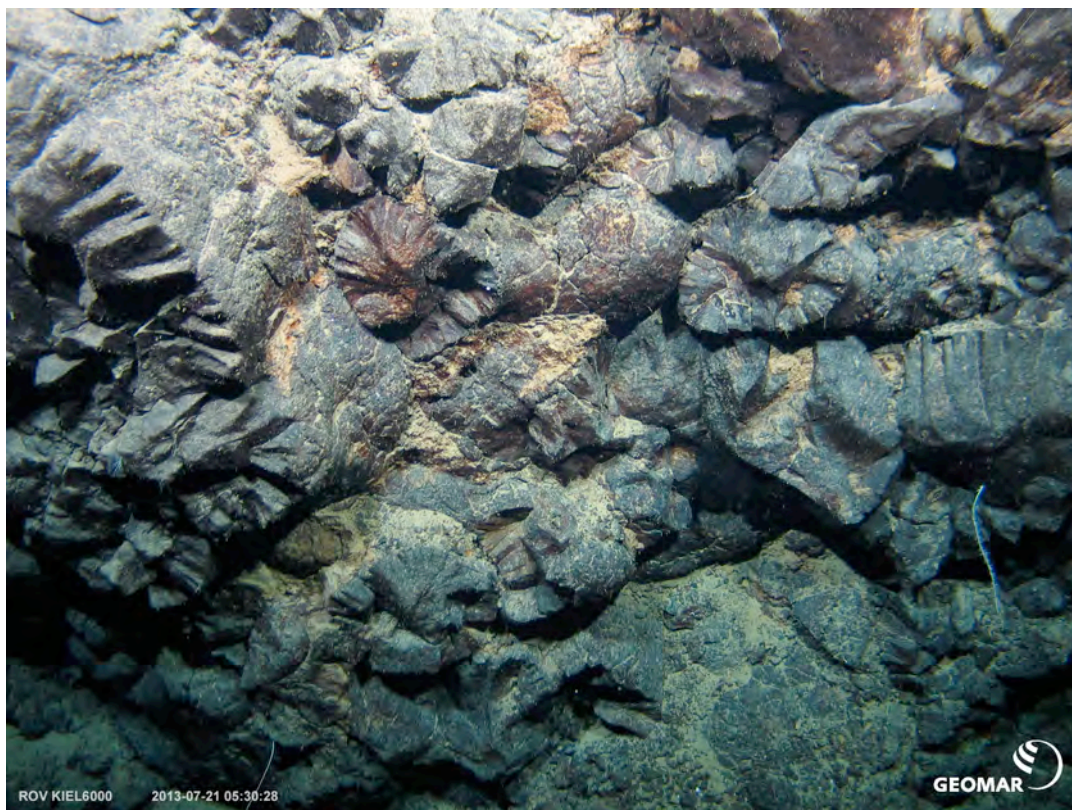
Kissenlaven am Südrand des Vate Troughs in etwa 1600 Metern Tiefe