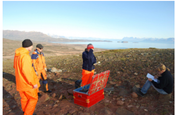
Abbau einer seismischen Registrierstation südlich von Mestersvig.

Das Wetter spielte dieses Mal mit. Bei herrlichem Sonnenschein wurden alle Stationen im Kong-Oscar-Fjord in Rekordzeit