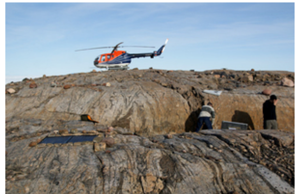
Aufbau einer GPS-Station auf der Insel Franske Oer.

Einige der geodätischen Punkte wurden bereits im letzten Sommer eingerichtet und erstvermessen. Diese werden teilweise in diesem Jahr erneut besetzt, um eine evtl. Hebung von bis zu 5 mm zu messen. Darüber hinaus wurden einige neue Punkte installiert. Die Vermarkung der Punkte erfolgt dabei auf festem Untergrund, d.h. auf oberflächlich anstehendem Fels. Dort wird ein kleiner Metallbolzen in den Fels eingebracht, auf dessen Spitze die GPS-Antenne direkt befestigt wird.