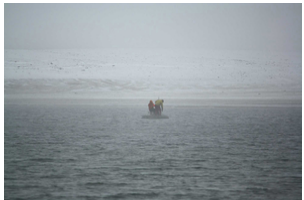
Vermessung der Wassertiefe von der Arbeitsplattform auf dem Sneha Soe