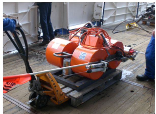
Oceanbottom seismometer close before the deployment. It is fixed on an anchor frame, which will remain on the seafloor after releasing the instrument.