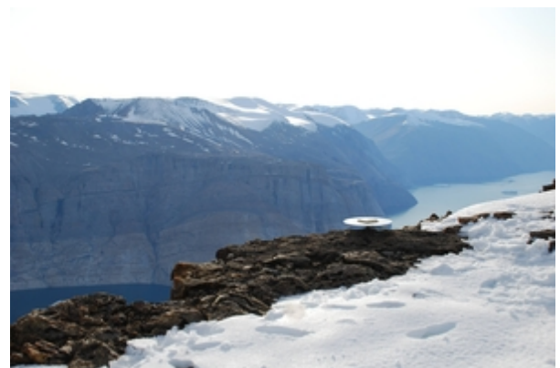
GPS Station am Eisfjord, zu sehen ist die GPS Antenne