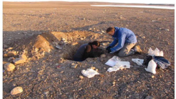
Pit to determine the depth of the perma frost