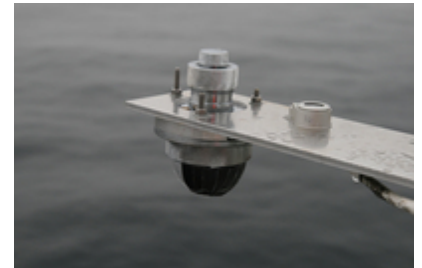
Pyranometer zur Messung der reflektierten solaren Strahlung von der Meeresoberfläche.

Zu Beginn der Woche kamen wir endlich in leichteres Eis. Es ging jetzt mit dem Messprogramm zügig weiter. Am Montagabend wurde das Schiff nach Süden versetzt, um ein weiteres tiefenseismisches Programm vorzubereiten. Die ganze Woche waren die Geophysiker damit beschäftigt 28 Ozeanbodenseismometer auszubringen. Entlang einer unterseeischen Vulkankette, dem Knipovich-Rücken, wurden gezielt Geräte auf den Meeresboden gesetzt, um die kleinen Erdbeben, die bei der Kontinentaldrift an dieser Nahtstelle entstehen, aufzuzeichnen. Diese Messungen sind am Sonntag zunächst beendet worden. Parallel zu den geophysikalischen Messungen wurden komplett andere Experimente durchgeführt, wie z.B. die Bestimmung der Strahlungsbilanz. Die zu Erde kommende Sonnenenergie wird zu fast 30% durch Wolken, Luft und Boden wieder in den Weltraum reflektiert. Die restliche Energie wird von der Atmosphäre (20%), dem Boden oder den Ozeanen absorbiert. Eines der Ziele ist es, die Strahlungsbilanz und den Zustand der Atmosphäre so genau wie möglich zu beobachten, um realistische Daten für die Fernerkundung und als Eingangsdaten für Klimamodelle zu erhalten.