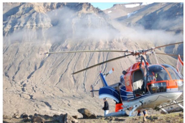
Abbau einer seismischen Registrierstation südlich von Mestersvig.