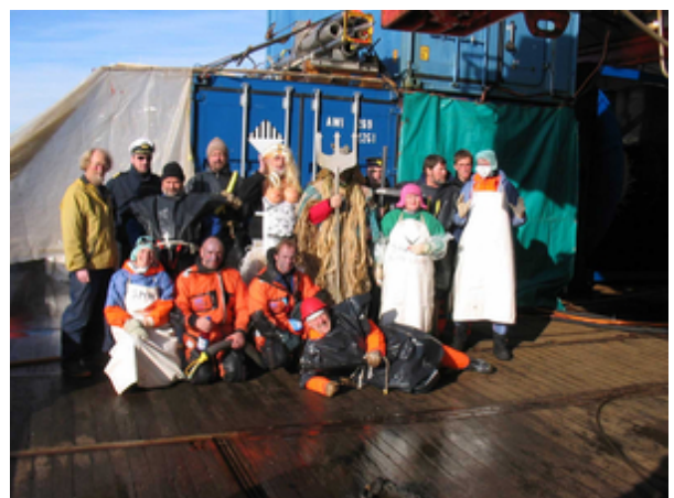
Neptun and his loyalty