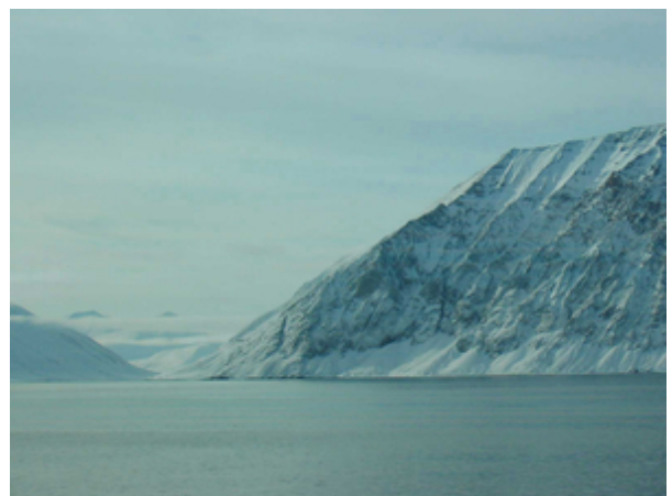
Snowy coast in the Kong Oscar Fjord