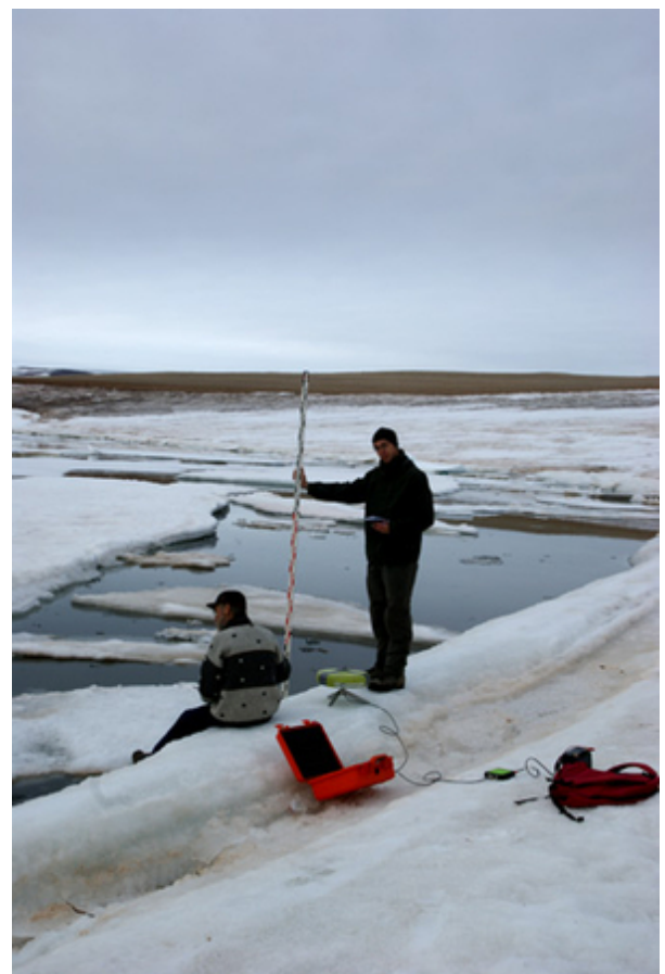
Holm Land - Einmessen eines Pegels, der in einer Meeresbucht auf Holm Land vorübergehend ausgebracht wurde. Mit der Pegelmessung kann man durch Wiederholungsmessungen feststellen, ob der Meeresspiegel steigt oder fällt.