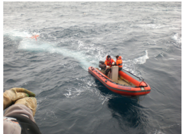
Oceanbottom seismometer is towed to the vessel after recovery