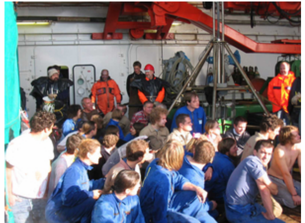
Die Opfer vor der Nordpolartaufe

Das Fazit dieser Reise ist überwiegend positiv. Während die Geologen, Geodäten, Biologen, Chemiker und Physiker durchweg eine gute Bilanz ziehen können, ist dies bei den Geophysikern eher gemischt. Zusätzlich zu technischen Problemen waren die Eisbedingungen in diesem Jahr vor Ostgrönland so schlecht, dass die eigentlichen wissenschaftlichen Ziele nicht vollständig erreicht werden konnten. Obwohl das Packeis nördlich 75°N Breite locker verteilt war, war das Meer in unserer Zielregion überwiegend zu mehr als 50% von Eisschollen bedeckt. Damit konnte unser 3000 m langes Messkabel nicht mehr sicher hinter dem Schiff geschleppt bzw. eingesetzt werden. Dieser ganze Programmteil wurde daher bis auf wenige Messungen gestrichen. Die anderen Experimente zum Wärmefluss und der Krustenmächtigkeit verliefen dagegen sehr erfolgreich, da sie an die Eisbedingungen angepasst werden konnten. Die Geophysiker haben einfach das falsche „Eisjahr“ erwischt, um auf dem Ostgrönlandschelf nördlich 75°N optimal arbeiten zu können. Dies gehört leider zu den