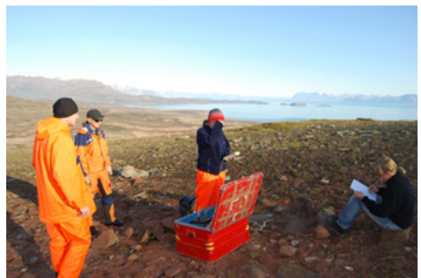
Retrieval of a seismic data logger south of Mestersvig.