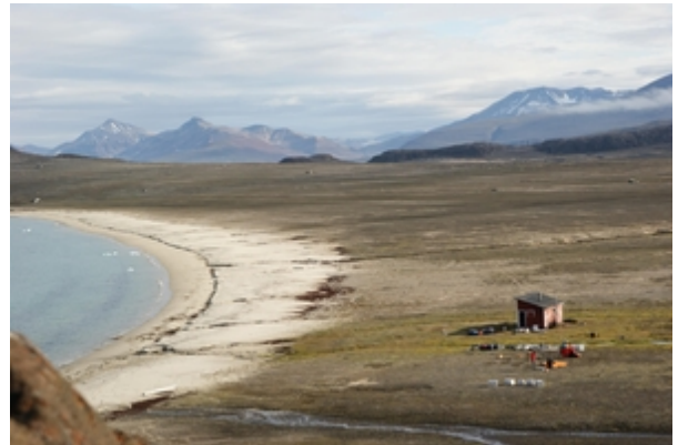
Geological camp close to Mestersvig; the tents are just being assembled

The weather, however, is less optimal. We sail since August 6th in dense fog. With temperatures between 5-10°C and drizzle we have already typical November weather. The weather conditions improved especially in the inner part of the fjord, which was essential for our