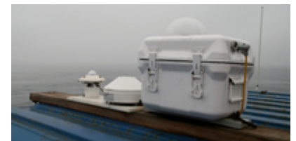
Links das Pyranometer (solare Strahlung) und das Pyrgeometer (langwellige Strahlung), rechts die Wolkenkamera mit dem Fischaugenobjektiv.

Dabei interessiert uns besonders, welchen Einfluss die Wolken und das Meereis auf die Strahlung haben. An Bord haben wir die einfallende kurzwellige Strahlung von der Sonne mit einem Pyranometer und die langwellige Rückstrahlung (Gegenstrahlung) von den Wolken mit einem Pyrgeometer gemessen. Alle 15 Sekunden nahm die Wolkenkamera ein Bild von der aktuellen Bewölkung auf und eine weitere Kamera machte jede Minute Fotos von der Eisoberfläche. Bei direkter Sonneneinstrahlung maßen wir außerdem mit einem Photometer die optische Dicke der Atmosphäre, um daraus den Aerosolgehalt zu berechnen. Wenn wir von Meereis umgeben waren, gab es alle paar Stunden eine manuelle Albedomessung. Weitere Daten, wie die Temperatur und die Luftfeuchtigkeit, erhielten wir über die Bordmessaanlage. Später werden wir den Strahlungstransport mit Wolken und Meereis modellieren und ein gekoppeltes Ozean/Atmosphäre/Meereis-Modell benutzen, um Energiebilanzstudien durchzuführen und den Einfluss der Wolken weiter zu untersuchen.