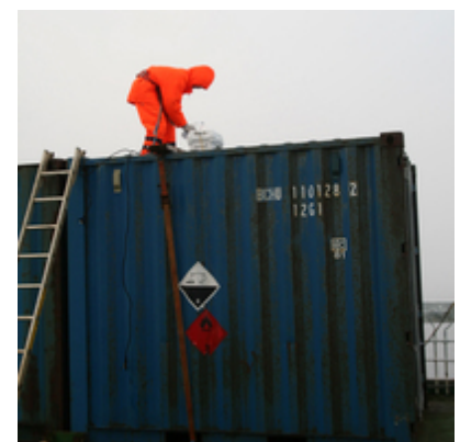
Cleaning the instruments on the container.