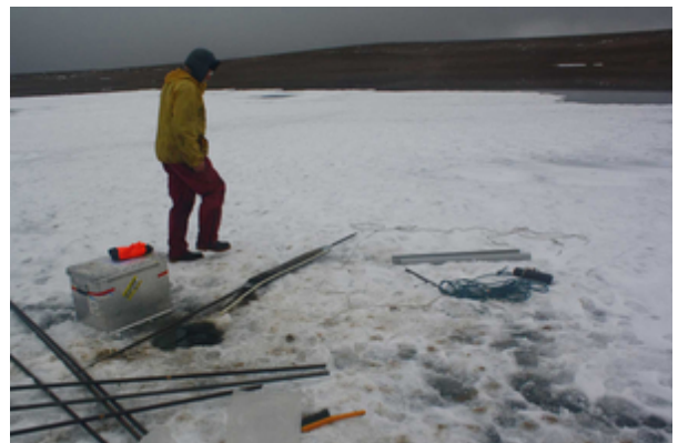
Beprobungsgeraete auf dem Sneha Soe