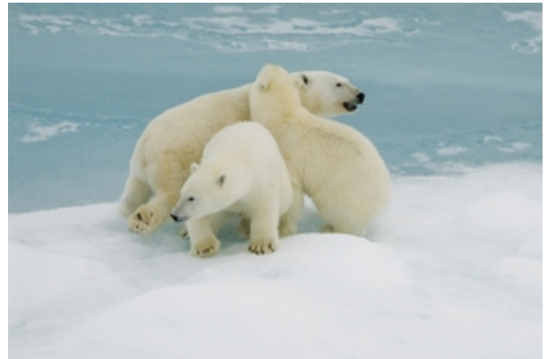
Polar Bear family in the Fram Strait.

Several geodetic stations have already been installed and observed during last year's summer, some of which are being re-observed during this season to measure the up to 5 mm uplift. Moreover, a number of new stations were set out. A geodetic point is basically a marker that is mounted to the bedrock, which has to be installed at the surface of the chosen location. The geodetic GPS antenna is then directly mounted on top of the marker. The geodesist's activities began during the first week of the cruise with our arrival in Kong Oscar Fjord, where a number of new GPS stations were installed and successfully observed. Several other stations were set out during the last week along Polarstern's path northward.