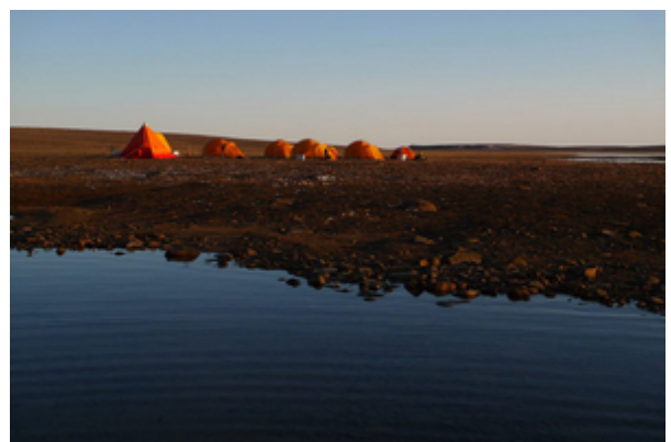
Geologen-Camp in Nordost-Grönland