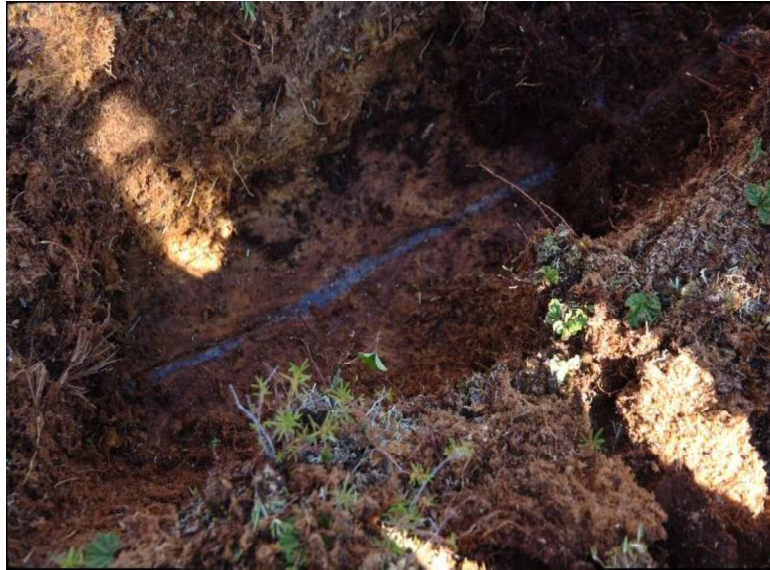
Рис. 4. Элементарная жилка, вскрытая между полигональными торфяниками. Июль 2017 г., Каргинская терраса, 12 км севернее ст. Обская.