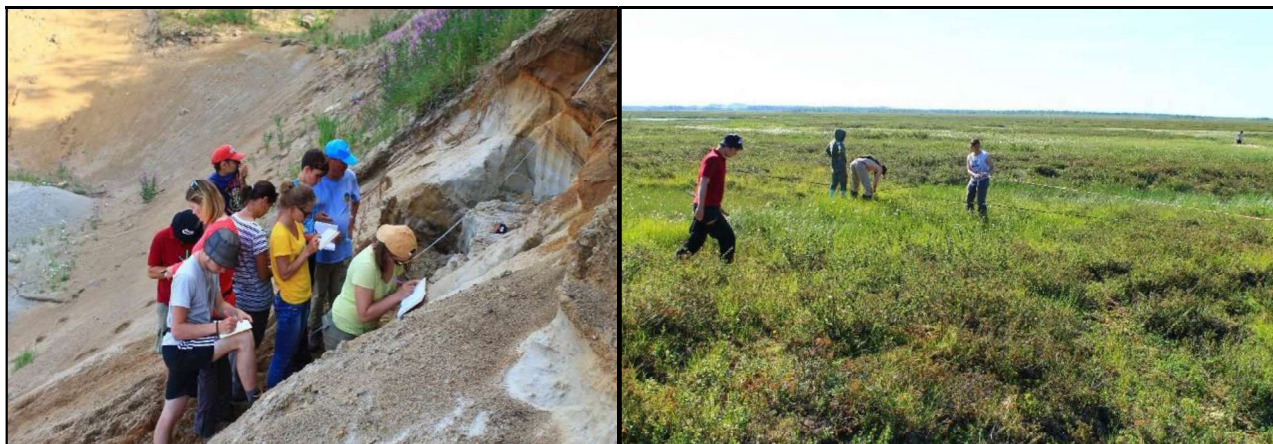
Рис. 1. Изучение ландшафтно-мерзлотных условий (слева) и обнажения верхнеплейстоценовых отложений в районе станции «Обская»

разграничения талых и мерзлых зон, для оценки интенсивности развития опасных криогенных процессов и явлений.