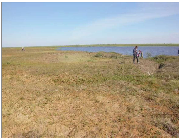
Рис. 5. Водораздельная поверхность, озерно-хасырейный тип местности, Каргинская терраса. Июль 2017 г.

Измерения глубины СТС (середина июля 2017 г.) показали существенные различия в зависимости от типа ПТК: в кустарниковой юной тундре – до 110–120 см, в пределах полигональных торфяников – 25–40 см. В шурфах для каждого типа проведены измерения температуры по глубине СТС. Интересные результаты получены при исследовании влияние микрорельефа местности и характера растительности на глубину СТС (табл.): чем мощнее слой мха и торфа, тем выше теплоизолирующая роль почвенно-растительных покровов; однако при избыточном увлажнении (увеличении осоки и пушицы влагалищной в составе растительных ассоциаций) мохово-торфяной покров заметно увеличивает свою теплопроводность.