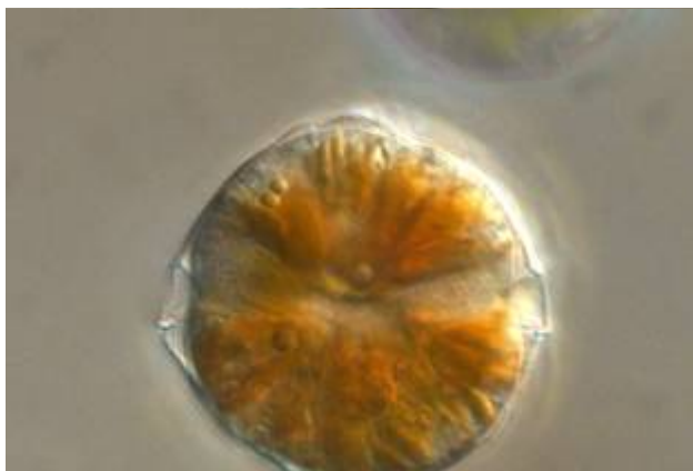
Dinoflagellat Alexandrium

Gefunden haben die Forscherinnen und Forscher ihr Studienobjekt innerhalb der Zellen von anderen Dinoflagellaten aus der Gattung Alexandrium . Zu der gehören etliche Arten, die als marine Giftmischer